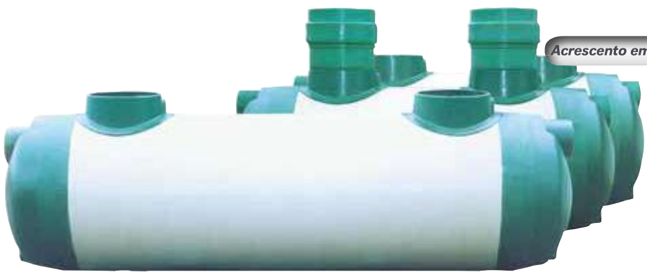
Acrescento em opção